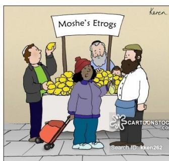
"$100 for a lemon? Are you crazy?!"