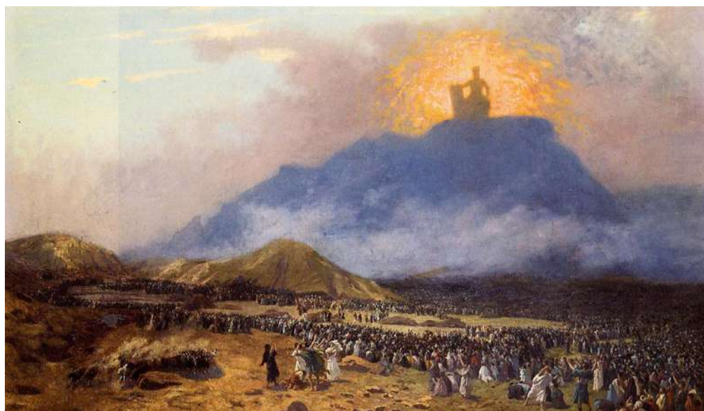
Jean-Leon Gerome (Jean Leon Gerome) (1824-1904) Moïse sur le mont Sinaï, ulje na platnu, 1895-1900, iz privatne zbirke