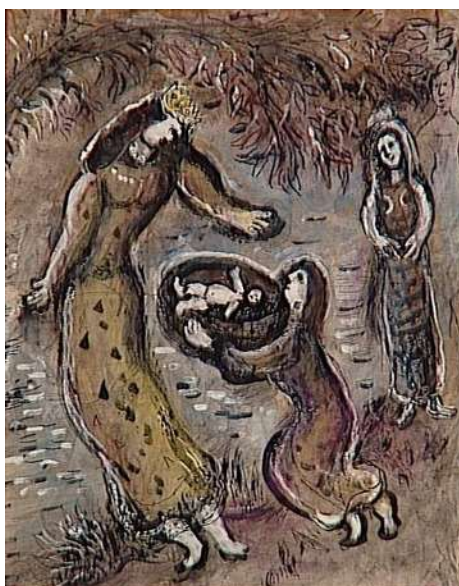
Moïse sauvé des eaux par la fille de Pharaon, Marc Chagall, 1966

Ne kažem da smo nasilni jedni prema drugima, mada je i to, nažalost, u porastu, koliko da nemamo senzibilnosti i osjećaja jedni za druge. Rabini su isticali da se čak i da-