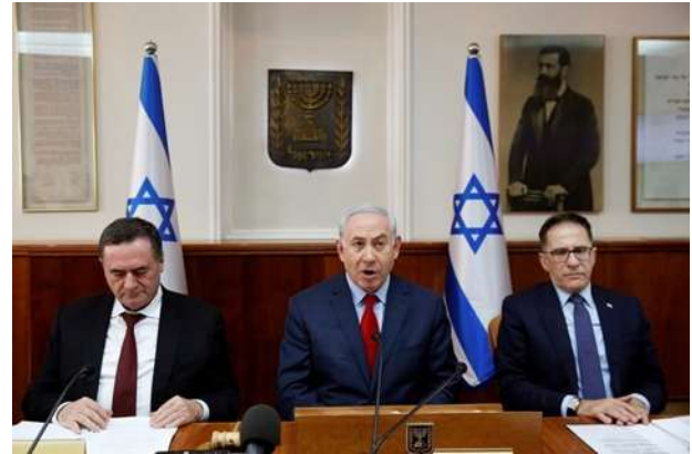
Izrael 2000. prekinuo odnose s Austrijom

"Za sada će Izrael zadržati radne odnose na razini visokih dužnosnika s ministarstvima koja vodi ministar iz FPÖ", navodi se u priopćenju. FPÖ utemeljili bivši nacisti,